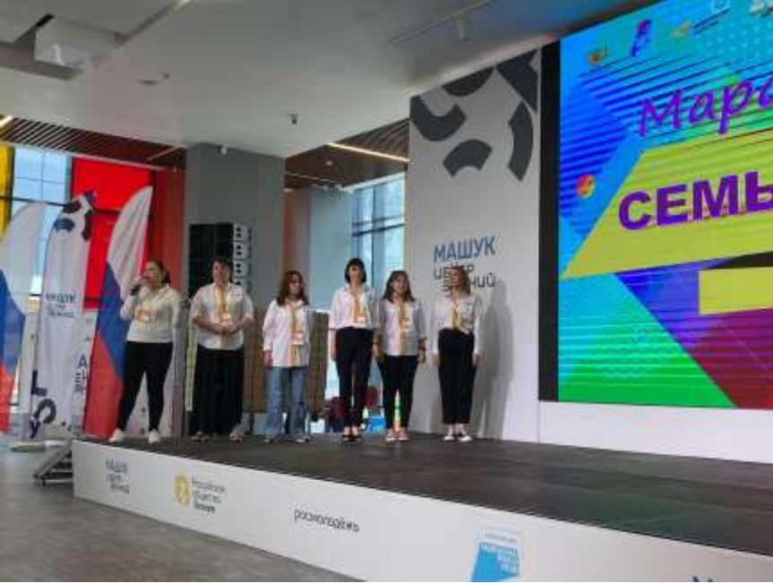
Защита проекта «Марафон «Семья+Школа», г. Пятигорск