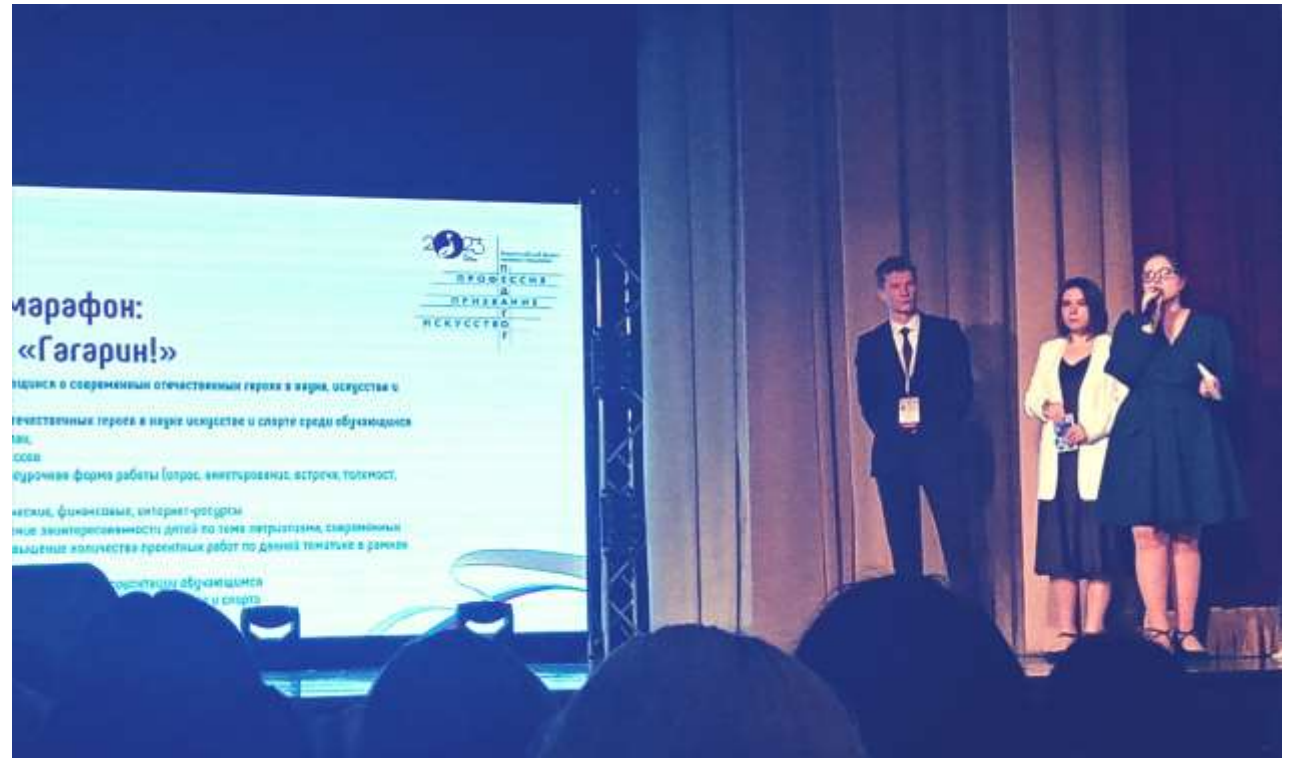
Защита проекта «Найдем нового «Гагарина»», г. Гатчина, Ленинградская область