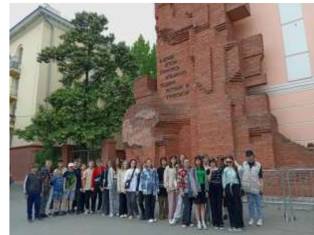
Поездка в г. Волгоград, май 2023г.