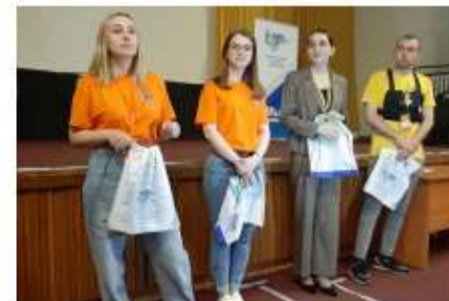
Победители конкурса «Педагогический дебют» с наградами от Профсоюза

Третий день ВПШ посвящен теме «Молодость. Методика. Мастерство». Все три понятия характеризуют выступления победителей Всероссийского конкурса «Педагогический дебют -2021» под лозунгом «Молодые – молодым: нам есть чему поучиться друг у друга». Поездка на нашу школу стала для них специальным призом от Общероссийского Профсоюза образования.