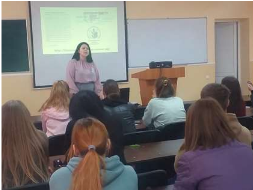
Выступление перед молодыми педагогами на «Семёновском слете» по теме: «Как стать успешным!»