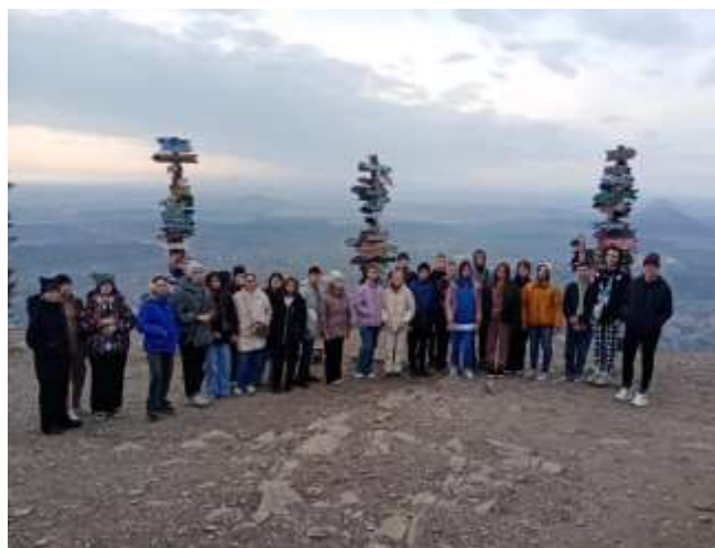
Поездка в г. Пятигорск, ноябрь 2023г.