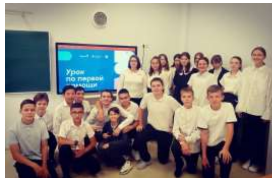
«Урок по Перовой помощи»