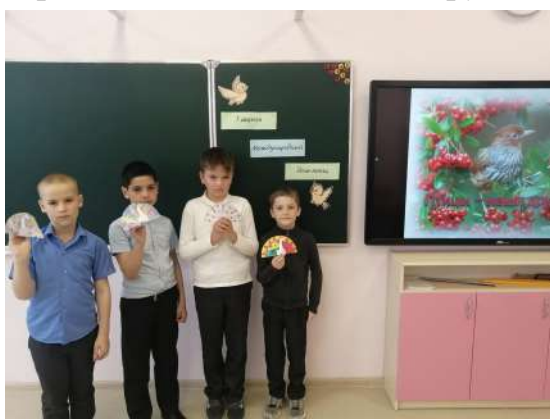
Ученики 4 «Г» класса.

Зимой очень трудно птицам. Они ждут нашей помощи. Сделайте и развесьте кормушки. Не забывайте подсыпать корм. Нерегулярное наполнение кормушки может вызвать гибель привыкших к подкормке пернатых. Птицы – наши друзья! Весной они нас отблагодарят.